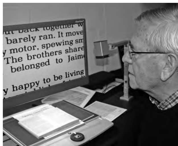
Au BrailleTech 2012

La Ligue Braille informe aussi les personnes déficientes visuelles sur les adaptations techniques leur permettant d'accroître leur autonomie dans le cadre de leur vie privée, scolaire et professionnelle. Du 18 au 20 octobre, se tenait d'ailleurs le BrailleTech, salon organisé dans les locaux de la Ligue Braille et qui rassemble les fournisseurs belges de matériel adapté. Ce salon, qui permet de tester, de comparer et d'être conseillé sur les différentes aides techniques, connaît un succès grandissant.