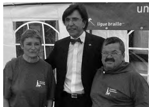
Le Premier au stand de la Ligue Braille

3 et 4 mai, Marcinelle. Cette année encore, la Ligue Braille participait à «Ensemble avec les Personnes Extraordinaires», un événement de sensibilisation au handicap basé sur l'information et l'interactivité entre les personnes valides et les personnes en situation de handicap. Le stand de la Ligue Braille y proposait des renseignements sur nos services et aides techniques, ainsi que des animations sensorielles.