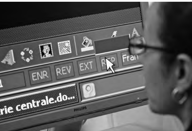
Informatica en slechtziendheid: niet onverenigbaar

Op 30 april 2013 hield de Brailleliga haar algemene vergadering. Het activiteitenverslag van 2012 werd er voorgesteld en goedgekeurd. Hier volgen de belangrijkste punten.