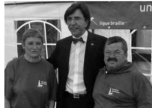
De Eerste Minister op de stand van de Brailleliga

3 en 4 mei, Marcinelle. Dit jaar was de Brailleliga opnieuw aanwezig op «Ensemble avec les Personnes Extraordinaires», een informatief en interactief evenement tussen valide en minder valide personen dat doelt op het sensibiliseren van het groot publiek omtrent diverse handicaps. Men kon op onze stand terecht voor informatie betreffende onze diensten en hulpmiddelen, of men kon er deelnemen aan diverse activiteiten die de zintuigen op de proef stelden.