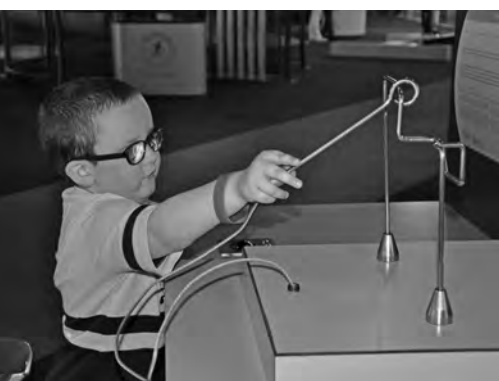
Allerhande ervaringen voor de kids in Technopolis

9 tot 12 mei, Namen. Het festival « Namur en mai » kreeg dankzij de aanwezigheid van de Brailleliga een apart tintje. Bezoekers konden op onze stand namelijk het gezicht van hun partner, zoon of dochter geblinddoekt schminken! Honderden bezoekers begaven zich naar onze stand om deze unieke belevenis te ervaren. De Brailleliga bood de bezoekers ook nog andere activiteiten aan waarbij de zintuigen op de proef werden gesteld en waardoor men gesensibiliseerd werd omtrent de problemen die leven met een visuele handicap met zich meebrengt.