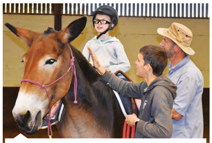
Les mules permettent aux enfants de réapprendre à nouer des contacts

a déstabilisé le milieu familial et obligé chacun à réinventer son quotidien. Pour un enfant déficient visuel, l'isolement a été accentué et les contacts sociaux ont été fortement impactés. S'aider des animaux est donc un moyen idéal pour permettre aux enfants de s'ouvrir à nouveau aux autres en douceur. La Ligue Braille souhaitait donc mettre sur "pattes" une journée au vert à destination des enfants aveugles et malvoyants,