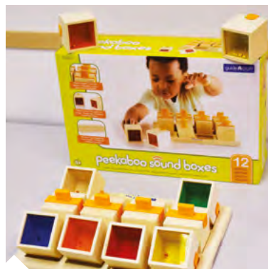
Cubes à sons (2266)

Lors des fêtes de fin d'année, le BrailleShop se met en mode festif et propose des idées-cadeau ludiques. Vous trouverez dans notre