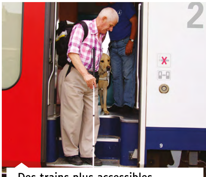
Des trains plus accessibles

Si l'accessibilité physique est un enjeu, l'accès à l'information