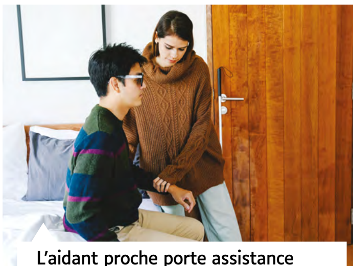
L'aidant proche porte assistance pour toutes les tâches du quotidien

la vie journalière, les surveillances de nuit, les déplacements, les heures de formation et de soutien ou encore, la participation à un groupe de parole et prévoit une allocation de remplacement. Pour en bénéficier, l'aidant proche introduit une déclaration sur l'honneur auprès de sa mutuelle.